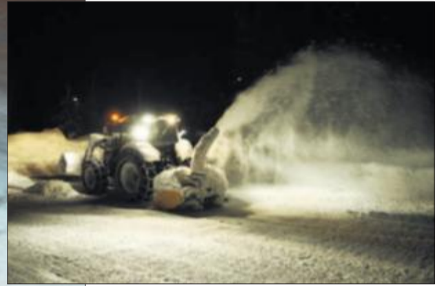
Ryddes: Parkeringsplassen på Heggem må ryddes for snø før alle skiglade foreldre og barn kan begynne med skileiken.